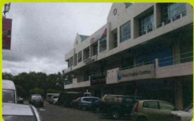
Global English Centre