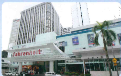
Inter Cultural Language School