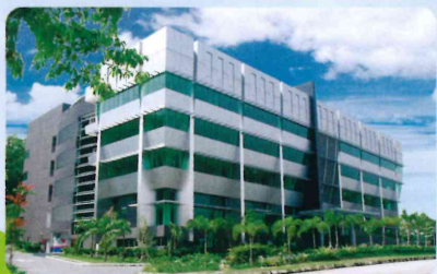
Asia Pacific University