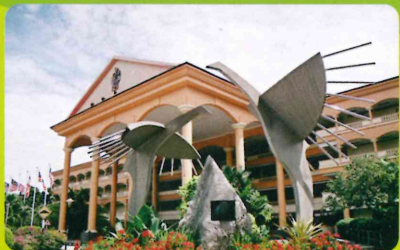
Sunway University College